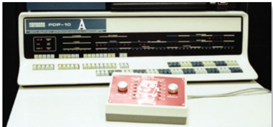
Компьютер DEC PDP-10

лишь потому, что старомодное жюри сочло использование компьютера жульничеством. Для своего времени «Трон» был почти как пресловутая «Матрица» для поколения девяностых. Фильм напичкан цитатами, недомолвками и туманными намеками, цифровые люди борются за равные права с людьми настоящими, а понятие «реальность» размывается во времени и пространстве и покрывает действие толстым слоем философичности. Фильм не снискал какой-то особой славы, но именно он вызвал к жизни серию сверхпопулярных игр. «Аркада» (в то время – на игровых автоматах) заработала больше денег, чем сама одноименная картина, и стала культовой. В Диснейленде появился «Суперскоростной тоннель» (по мотивам «троновских» гонок на световых мотоциклах). 25 августа 2003 года вышла игра Tron 2.0 – стрелялка от первого лица, а в 2004 г. – ее продолжение, Tron 2.0: Killer App. Многие элементы фильма можно встретить в игре Darwinia. ►