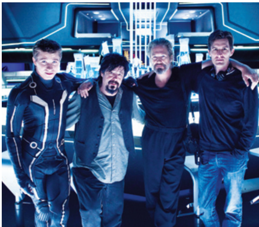
Слева направо Гаррет Хедлунд, Стив Лисбергер, Джефф Бриджес и Джозеф Косински на съемочной площадке фильма «Трон: Наследие»

Кевин Флинн (Бриджес) – молодой и одаренный программист, хакер-геймер, работает на мега-корпорацию ENCOM. Парень создает новаторские игры, однако его начальник Эд Диллинджер (Уорнер) нагло присваивает авторство и получает причитающиеся Кевину гонорары. В один прекрасный день Диллинджер лишает всех программистов с седьмым уровнем авторизации (в том числе и Кевина) доступа к MCP (Master Control Program) – искусственному интеллекту, управляющему сетью компьютеров корпорации. Двое сотрудников решают помочь нашему герою взломать систему... и тут происходит невероятное событие – Флинн оказывается «оцифрованным» и попадает внутрь компьютера, и теперь он вынужден бороться за жизнь на футуристического вида гладиаторской арене. Там его ждет совершенно иной мир. Оказывается, компьютерные программы живут в тоталитарном обществе, а MCP – весьма жестокий правитель. Обычные программы содержатся в своеобразных «концлагерях» и периодически участвуют в жестоких гладиаторских боях. В этом мире своя религия – программы верят в то, что у них есть высшие существа-покровители, некие «Пользователи». Когда Флинн попадает в