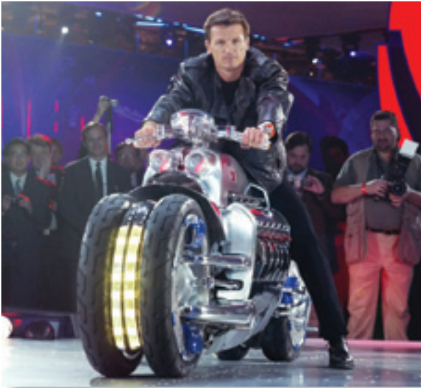
Постер к фильму «Трон: Наследие»